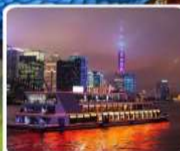
ส่องเรือแม่น้ำหวงผู่