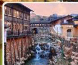
เมืองโบราณเหย้าหู