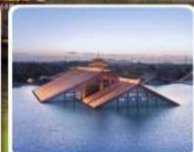
พิพิธภัณฑ์ไดน้ำ กวางฟู่หลิน