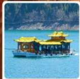
ล่องเรือทะเลสาบกีเยนจื่อ