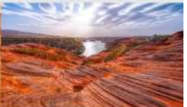
อุทยานหุบเขาคีลิน

*ทางบริษัทฯ ขอสงวนสิทธิ์ในการสลับโปรแกรมทัวร์ตามความเหมาะสมขึ้นอยู่กับสถานการณ์ทำงาน โดยคำผิดซึ่งผลประโยชน์ของลูกค้าเป็นสิ่งสำคัญ