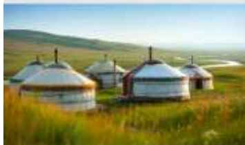
ทุ่งหน้าออร์ดอส