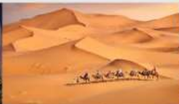
ทะเลทรายเสียงชวาน