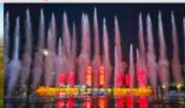
น้ำพุคังปาซือ