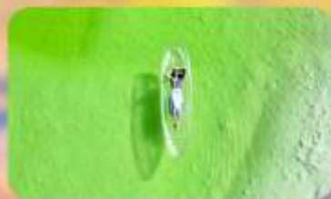
ทะเลสาบเกลือดาเอ๋อร์ฮั่น