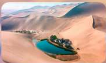
เหมินทรายหมิงซาซาน