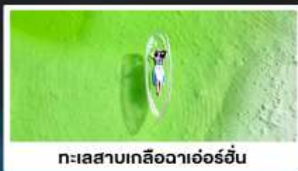
ทะเลสาบเกลือดาเอ๋อร์อัน