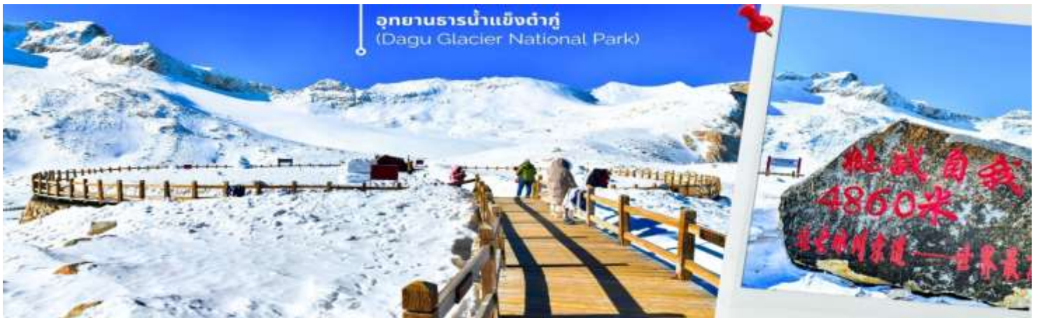
การตกและความหนาวของหิมะขึ้นอยู่กับสภาพอากาศ

จากนั้นนำท่านเดินทางสู่ เมืองเฮยฮุย (ใช้เวลาเดินทางประมาณ 2 ชั่วโมง)เพื่อเดินทางไปยัง อุทยานธารน้ำแข็งต้ากู่ปิงชว่น(รวมกระเช้าขึ้นลง) ต้ากู่ปิงชว่น หรือ Dagu Glacier National Park เป็นธารน้ำแข็งกลางเขี้ยวที่สวยงามที่สุดแห่งหนึ่งของโลก และเป็นสถานที่ท่องเที่ยวระดับ 4A ของจีน ตั้งอยู่ที่เมืองเฮยฮุย ในมณฑลเสฉวน ห่างจากเมืองเฉิงตูประมาณ 300 กิโลเมตร ถือเป็นธารน้ำแข็งที่อายุน้อยที่สุด ที่ตั้งอยู่ในระดับความสูงที่ต่ำที่สุด และอยู่ใกล้กับเมืองมากที่สุดในบรรดาธารน้ำแข็งทั้งหมด โดยอยู่สูงจากระดับน้ำทะเลประมาณ 3,800-5,100 เมตร จุดสูงที่สุดที่นักท่องเที่ยวสามารถขึ้นไปได้จะอยู่ที่ 4,860 เมตร