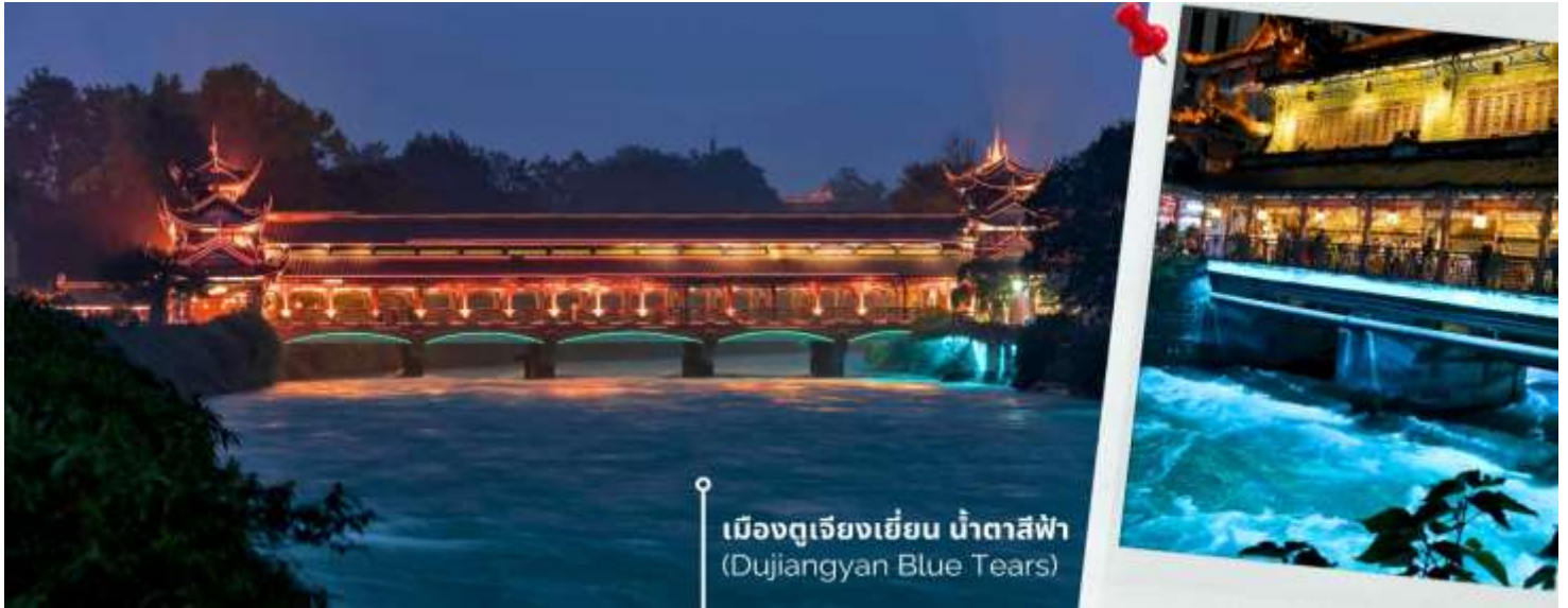
เมืองดูเจียงเยียน น้ำตาสีฟ้า (Dujiangyan Blue Tears)