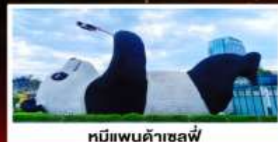
หมีแพนด้าเซลฟี