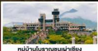
หมู่บ้านโบราณชนเผ่าเซียง