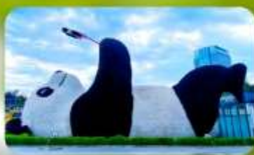
หมีแพนด้าเซลฟี่