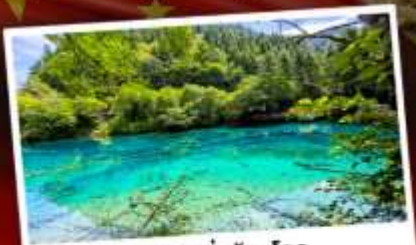
อุทยานจิ้งจายโกว