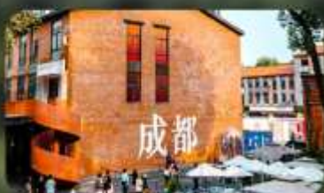
ดงเจียวจี้

HOLIDAY INN EXPRESS HOTEL หรือเทียบเท่า 4 คาว