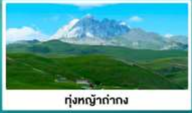
ทุ่งหญาด่างง