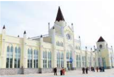
สถานีรถไฟฮาร์บิน

หมายเหตุ เพื่อความสะดวกในการเข้าพักใน HOME STAY ภายในหมู่บ้านหิมะ ทางทัวร์แนะนำให้ท่าน จัดเตรียมเสื้อผ้าและเครื่องใช้เท่าที่จำเป็น 1 ชุดใส่กระเป๋าใบเล็กหรือเป้แบบสะพายได้ เพื่อสะดวกในการนำติดตัวไปใช้สำหรับคืนที่นอนในหมู่บ้านหิมะ หากนำกระเป๋าเดินทางใบใหญ่เข้าสู่ที่พักในหมู่บ้านอาจสร้างความไม่สะดวกแก่ท่าน จึงไม่แนะนำ