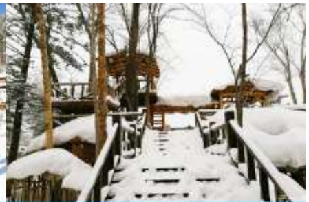
ระเบียงชมวิวยิ่งยู่ซาน

วันที่สาม เมืองฮาร์บิน-สถานีรถไฟฮาร์บิน-รวมนั่งมาลากเลื่อน- หมู่บ้านหิมะ Xue xiang China Snow Town - ระเบียงชมวิวยิ่งยู่ซาน- ชมแสงสียามราตรีหมู่บ้านหิมะ-ชมพลุไฟและขบวนพาเหรดระบำพื้นเมือง-นอนในหมู่บ้านหิมะ Xue xiang