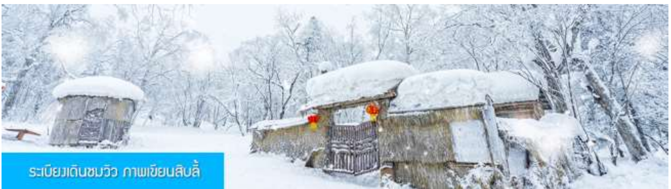
ระเบียงเดินชมวิว ภาพเขียนสิบสี่

ตามความสมัครใจ ***อิสระอาหารกลางวัน และ อาหารค่ำ เพื่อให้ท่านสะดวกในการพักผ่อนอย่างเต็มสุข