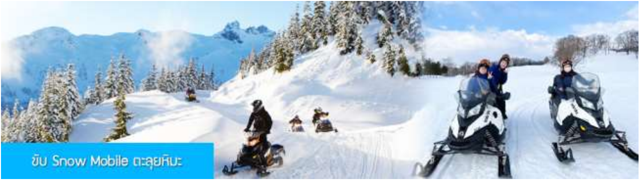
ขับ Snow Mobile ตะลุยหิมะ

รายการที่ 2 นั่ง SNOW MOBILE ตะลุยทุ่งหิมะและพิชิตยอดเขา 雪地摩托车 ให้ท่านซ้อนท้าย SNOW MOBILE (มีผู้ชำนาญเส้นทางขับและให้ท่านนั่งซ้อนท้าย) ตะลุยทุ่งหิมะและเนินเขาตามเส้นทางธรรมชาติ ท่ามกลางแนวป่าที่มีต้นไม้อ่อนที่มีน้ำแข็งเกาะอยู่ตามกิ่งไม้ ภูเขาทั้งลูกถูกห่อหุ้มด้วยหิมะขาวฟูอย่างสนุกสนาน เวลาที่ใช้สำหรับรายการขับ SNOW MOBILE ประมาณ 10 - 20 นาที อัตราค่าบริการ ท่านละ 380 หยวน หรือ 1900 บาท อัตรานี้รวมค่า SNOW MOBILE ค่ารถรับ ส่ง และค่าบริการของไกด์ท้องถิ่น และค่าบริการจัดการของบริษัททัวร์ท้องถิ่น หมายเหตุ โปรแกรมเสริมเป็นโปรแกรมที่ท่านต้องเสียค่าใช้จ่ายเองด้วยความสมัครใจ สำหรับท่านที่ไม่เข้าร่วมกิจกรรมดังกล่าวสามารถนั่งพักที่ศูนย์บริการนักท่องเที่ยวได้