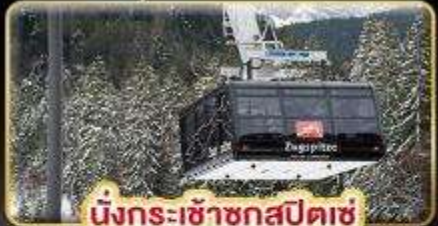
นั่งกระเช้าชุกสปีตซ์

✈️ มินุรุ Full Service น้ำหนักกระเป๋า 25 kg.