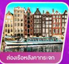
ส่องเรือสิงคารถะจก

เที่ยวเทศกาลดอกไม้เคอเคนฮอฟ ชมแคว้นอาลซัส หมู่บ้านสวยที่สุดในฝรั่งเศส เยือนเมืองมรดกโลก