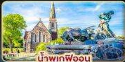
น้ำพุเทพอน