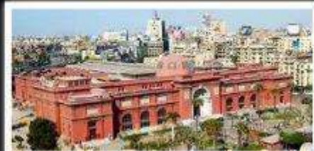
พิพิธภัณฑ์สถานแห่งอียิปต์