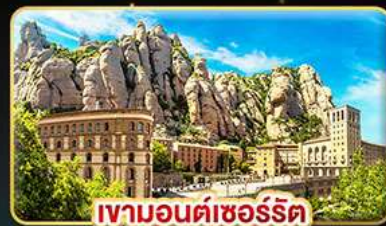
เขามอนต์ซอร์ริต