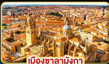
เมืองซาลามังกา