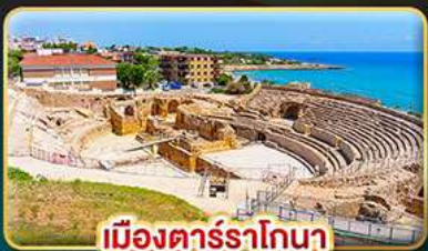
เมืองตาร์ราโกนา

📅เดินทาง : 10-17 เม.ย. | 17-24 เม.ย. 01-08 พ.ค. 69