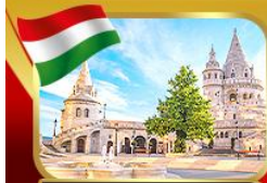
ป้อมชาวประมงเมืองบูดาเปสต์