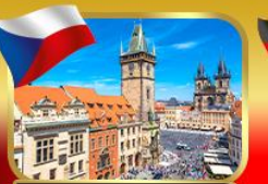
ชมวิวนรรมยาทาศเมืองปราก