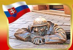
เซ็กอินคูคูนิลเมืองบาตีสลาวา