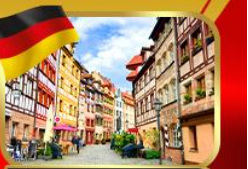
เที่ยวย่านเมืองเก่าบูเรมเบิร์ก