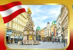
ช้อปปิ้งย่านคาร์ทเนอร์สตรีก