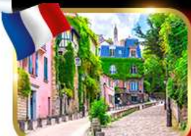
Rue de l'Abreuvoir มงมาร์ต