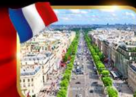
เดินเล่นย่านช็องเซลีซ