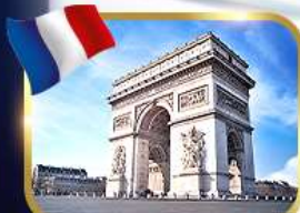
ประตูชัยอาร์กเดอทรียัมป์