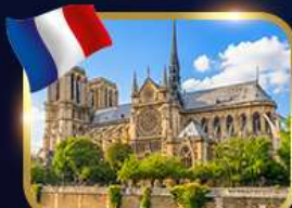
มหาวิหารนอร์ดอกเทอร์ตาม