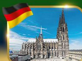
มหาวิหารแห่งเมืองโคโลญ