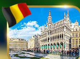
จัตุรัสกรองด์ ปลาซ บริซเซลส์