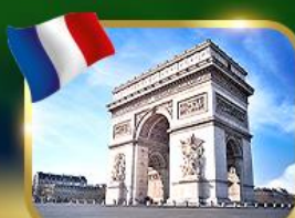
ประตูชัยฝรั่งเศส ปารีส