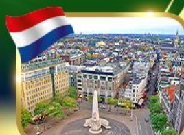
จัตุรัสดีสนแควร์ ฮังการี