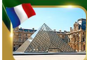
พีระมิดที่ลูฟวร์ ปารีส