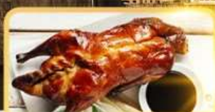
เปิด Four Season