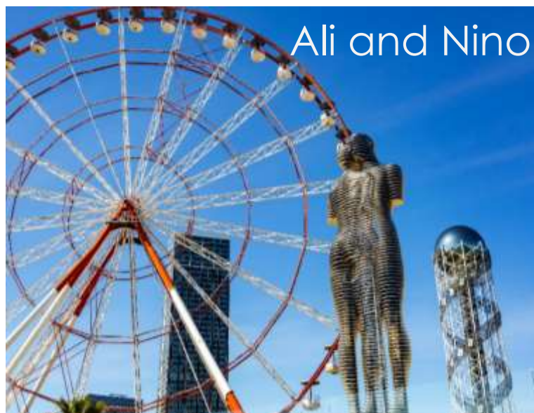
Ali and Nino

จากนั้นนำท่านสู่ถนนเลียบชายหาดบาตูมิ (Batumi Promenade) ถนนเลียบชายหาดที่ยาวถึง 6 กิโลเมตร สร้างขึ้นตั้งแต่ปี ค.ศ. 1884 ประดับด้วยน้ำพุงดงามตลอดสาย และเป็นถนนที่ยาวที่สุดบนชายหาดทะเลดำ ทิศนียภาพผสมผสานวิวภูเขาและวิวทะเล นำชมแลนด์มาร์คสำคัญๆ ตลอดถนน ชมอนุสาวรีย์อาลีและนีโน (Ali and Nino Monument) เป็นสถาปัตยกรรมโลหะสมัยใหม่ ทำด้วยเหล็ก เคลือบไหมได้ ความสูงประมาณ 8 เมตร ผลงานศิลปินชาวจอร์เจีย Tamara Kvesitadze ที่บอกเล่าเรื่องราวความรักและความเศร้าของ อาลี หม่อมมุสลิม กับเจ้าหญิงนีโน แห่งจอร์เจีย หลังจากถูกกองทัพโซเวียตรุกราน จากวรรณกรรมของนักเขียนชาวอาเซอร์ไบจาน นอกจากนี้ยังมีความพิเศษคือรูปปั้นนี้ จะขยับเข้าหากันในเวลา 19.00 น.ของทุกวัน ถ่ายรูปกับหอคอยขิงซ่าสวรรค์ (Alphabetic Tower) ที่ตั้งริมทะเล