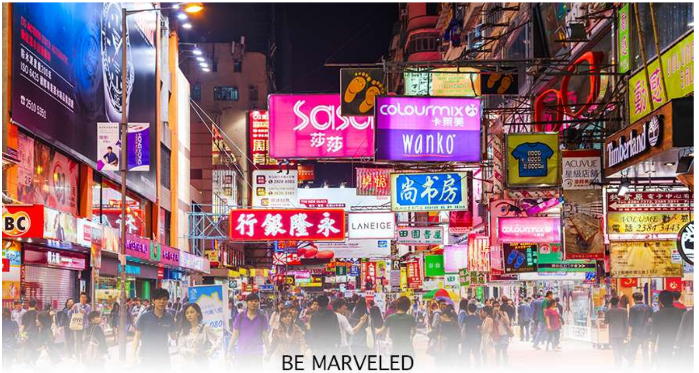
BE MARVELED TSIM SHA TSUI

📍 อีตระอาหารอาหารเข็นตามอรัยาศัย **เพื่อความสะดวกในการช้อปปิ้ง**