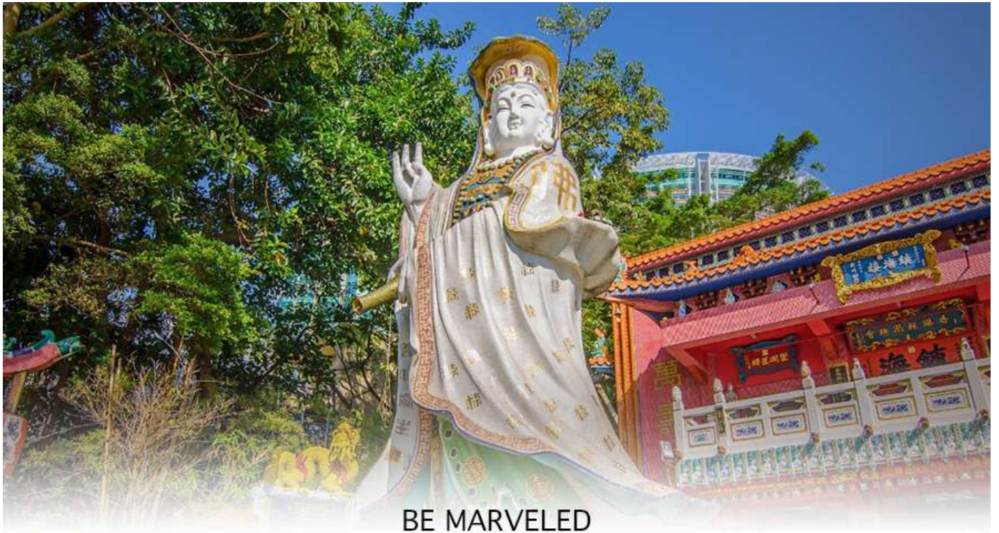
BE MARVELED วัดเจ้าแม่กวนอิมริพลัสเบย์

จากนั้นนำท่านสู่ เจ้าแม่กวนอิม วัดฮ่องกง (HUNG HOM KWUN YUM TEMPLE) เป็นหนึ่งในวัดที่เก่าแก่ที่สุดของฮ่องกง และชาวฮ่องกงเลื่อมใสศรัทธามาก สร้างขึ้นในปี ค.ศ.1873 ในสมัยช่วงสงครามโลกครั้งที่ 2 มีการปล่อยระเบิดลงบริเวณใกล้กับวัดแห่งนี้หลายต่อหลายครั้ง ทำให้มีผู้บาดเจ็บและล้มตายมากมาย แต่ชาวบ้านที่หนีเข้าไปหลบภัยในวัดนี้ก็ปลอดภัยอย่างปาฏิหาริย์ และตัววัดก็ไม่ได้ได้รับความเสียหายจากเหตุการณ์ทิ้งระเบิดที่น่าอัศจรรย์ ตามความเชื่อของคนจีนในฮ่องกง-มาเก๊า จะมี ”วันเปิดทรัพย์“ หรือ ”พิธียืมเงิน เจ้าแม่กวนอิมฮ่องกง“ เป็นวันที่จะมาขอพรและยืมเงินเจ้าแม่กวนอิม ซึ่งนับจากหลังวันตรุษจีน ไป 26 วัน จะเป็นวันเปิดทรัพย์ที่จัดขึ้นในทุกๆปี พิธีนี้จะมีเพียงครั้งปีละครั้งเท่านั้น เป็นวันสำคัญอีกวันที่คนหลังไหลมาไหว้ขอพรอย่างไม่ขาดสาย