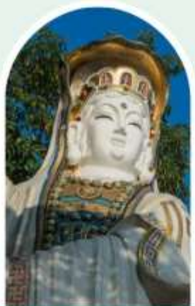
เจ้าแม่กวนอิม ธิพลสัย