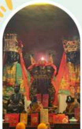
วัดหมิ่นโหมว