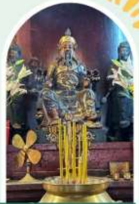
วัดปีกโตฮองฮำ