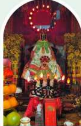
วัดเจ้าแม่กวนอิมฮองฮำ