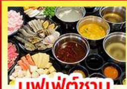
บุฟเฟ่ต์ซาบู