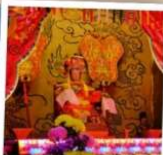
เจ้าแม่ทับทิม จอสเฮาส์เบย์