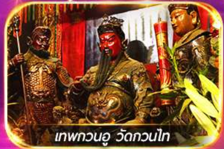
เทพทวนอู วัดกวนไท

พามูไหว้พระขอพร 8 วัดดัง เล่นเครื่องเล่นดิสนีย์แลนด์เต็มวัน ชมพลุสุดอลังการ