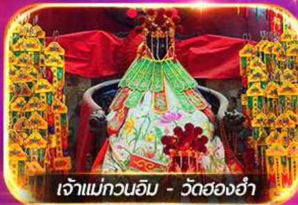
เจ้าแม่ทวนอิม - วัดฮ่องกง