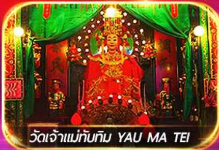
วัดเจ้าแม่ทับทิม YAU MA TEI