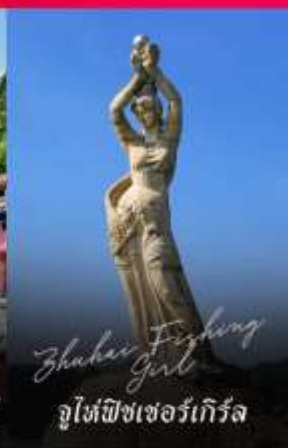
Zhuhai Fighting Girl จูไห่พิชเชอร์เทียร์