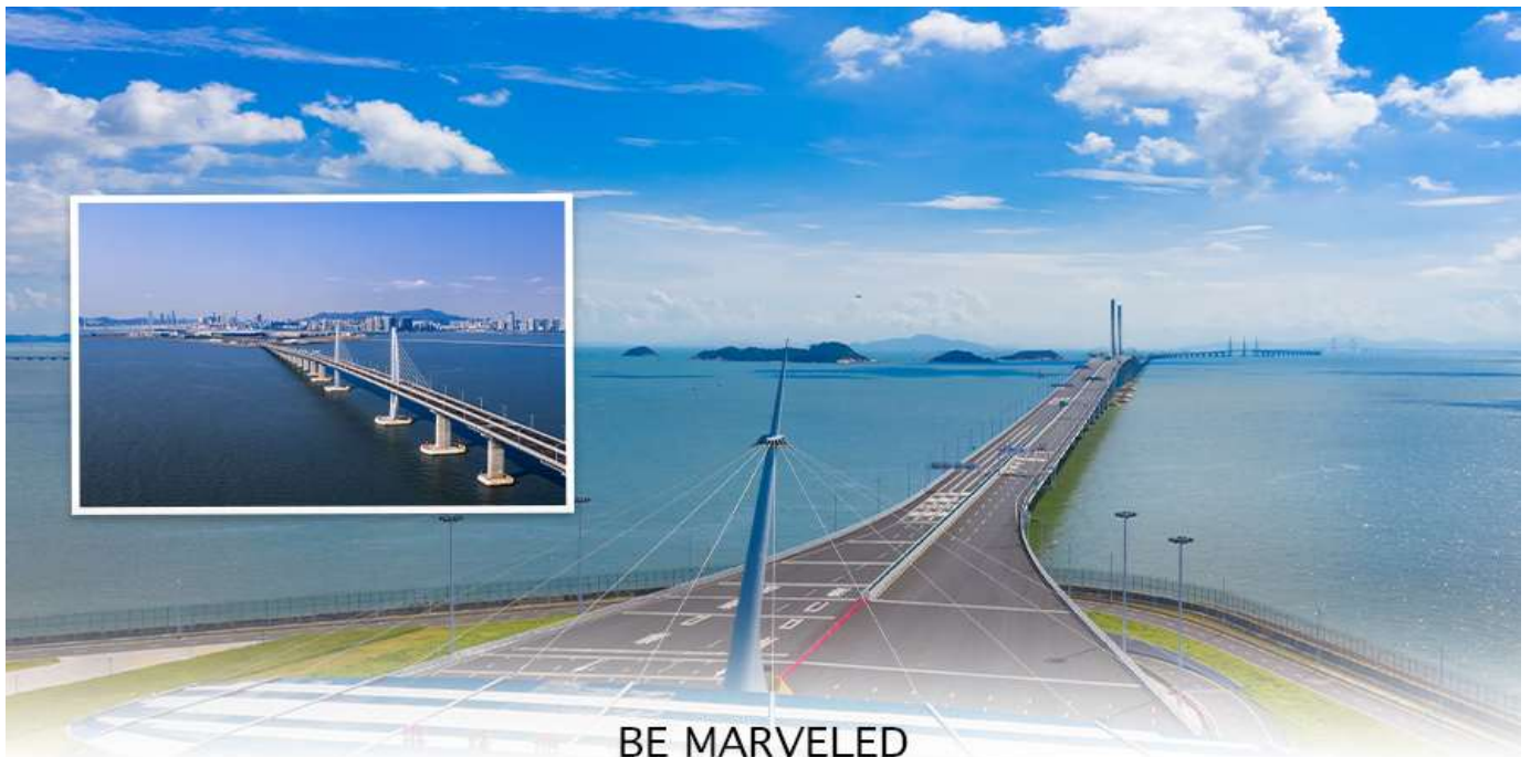
สะพานข้ามทะเล ฮ่องกง มาเก๊า จูไห่ HZMB

07.00 น. เดินทางถึง สนามบินเซ็กเล็ปก๊อก (CHEK LAP KOK INTERNATIONAL AIRPORT) เขตปกครองพิเศษฮ่องกง หลังผ่านพิธีการตรวจคนเข้าเมืองเป็นที่เรียบร้อยแล้ว รับกระเป๋าสัมภาระ เดินทางโดยรถโค้ชปรับอากาศ (เวลาที่ท้องถิ่นที่ฮ่องกง เร็วกว่าประเทศไทย 1 ชั่วโมง)