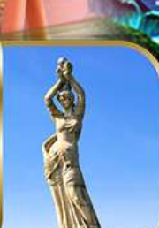
จู๊ฟิชเซอร์ทิสรา