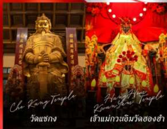
Che Kung Temple วัดแชกง

รายการทัวร์ข้างต้นอาจมีการปรับเปลี่ยนเพื่อความเหมาะสม