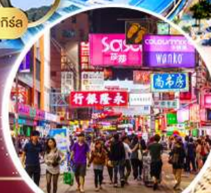
Shopping Tsim Sha Tsui