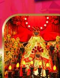
วัดเจ้าแม่กวนอิม ดงซา