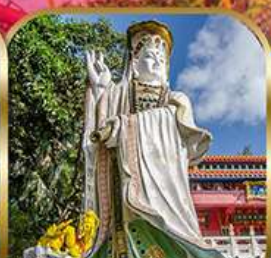
เจ้าแม่กวนอิมรี พลัสเบย์