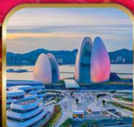
Zhuhai Opera House