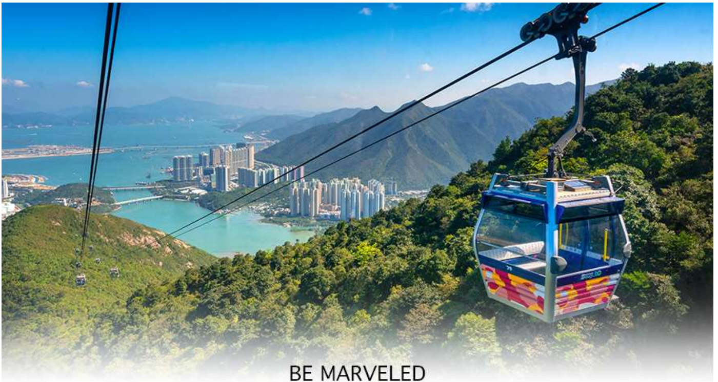
BE MARVELED กระเช้านองปิง

ล่าง ซึ่งการเดินทางขึ้นไปสักการะองค์พระใหญ่อย่างใกล้ชิดนั้น ต้องเดินขึ้นบันได จำนวน 268 ขั้นและได้รับเลือกให้เป็นสิ่งมหัศจรรย์ทางวิศวกรรมขั้นที่ 4 จากทั้งหมด 10 ชั้นของฮ่องกงในปี ค.ศ. 2000 ถือเป็นพระพุทธรูปองค์ใหญ่ที่เป็นสุดยอดของประติมากรรมทางพุทธศาสนาที่มีการผสมผสานระหว่างศิลปะสำริดแบบดั้งเดิมกับเทคโนโลยีสมัยใหม่ ชาวฮ่องกงเชื่อว่าหากใครได้มานมัสการขอพรองค์พระใหญ่แห่งนี้แล้ว ชีวิตก็จะมีแต่ความโชคดี มีความสุขสมหวัง และประสบความสำเร็จในทุกๆด้าน หลังจากไหว้พระแล้วท่านสามารถเลือกซื้อของฝาก, ของที่ระลึก จากหมู่บ้านนองปิง อาทิเช่น หยก ไข่มุก หรือเครื่องประดับคริสตัล เพื่อเป็นของที่ระลึก จากนั้นนั่งกระเช้ากลับลงมายังสถานีคิงซุง