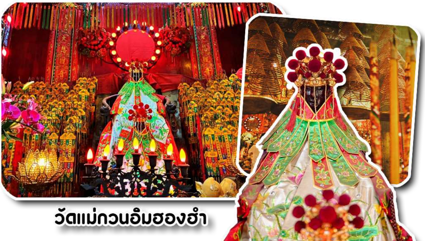
วัดแม่กวนอิมฮ่องฮำ

1873 เป็นวัดขนาดเล็กที่มีชาวฮ่องกงศรัทธาแน่นทึบกันเป็นอย่างมาก วัดแห่งนี้เป็นที่ประดิษฐาน องค์เจ้าแม่กวนอิมฮ่องฮำ ที่มีชื่อเสียงเรื่องการให้กู้ยืมเงิน เชื่อกันว่าท่านช่วยพลิกฟื้นเศรษฐกิจของชาวฮ่องกง ผู้คนจึงนิยมมายืมเงินทำธุรกิจจนสำเร็จร่ำรวย รุ่งเรือง โดยให้ท่านอธิษฐานขอพรต่อหน้าเจ้าแม่กวนอิมฮ่องฮำ พร้อมกับระบุวันเวลาในการขอพรด้วย จากนั้นนำธูปธูปตามฐานะและศรัทธาที่เฝ้าจะนำเป็นสื่อในการขอพร เขียนจำนวนเงินที่ต้องการลงไปด้วย ใส่สกุลเงินยิ่งดีใหญ่ แล้วนำเงินใส่ในซองแดง ควรเตรียมซองแดงไปเอง นำซองแดงไปวนรอบกระถางธูป วนขวาจำนวน 3 ครั้ง แล้วเก็บซองแดงในกระเป๋าสตางค์ เป็นเงินขวัญถุง ถ้าประสบความสำเร็จตามที่มุ่งหวังให้นำเงินในซองแดงทำบุญหยอดตู้ที่วัดแห่งนี้ในโอกาสต่อไป วิถีไหว้ให้ปัง ให้ได้โชคลาภเงินทอง ต้องไปกับเจ้าเท่านั่น