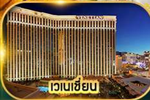
เวเนเซียน