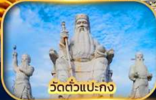
วัดตัวแปะกง