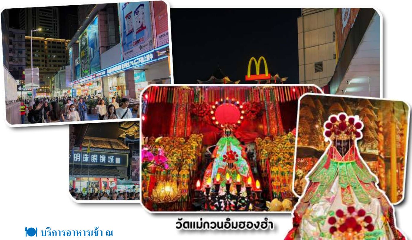
วัดแม่กวนอิมสองอ้า

ฮ่องกง - แม่กวนอิมสองอ้า - วัดปักไต้ - ร้านกั้งหัน - ร้านหยก - วัดแขก - - ซุปปิ้งจิมซาจู้ - สนามบิน ( B/L/X )