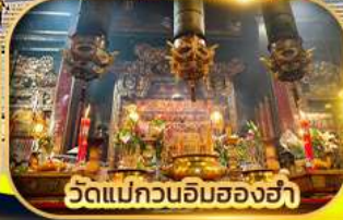
วัดแม่กวนอิมสองอ่า