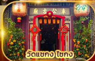
วัดเขangkง ไซกง