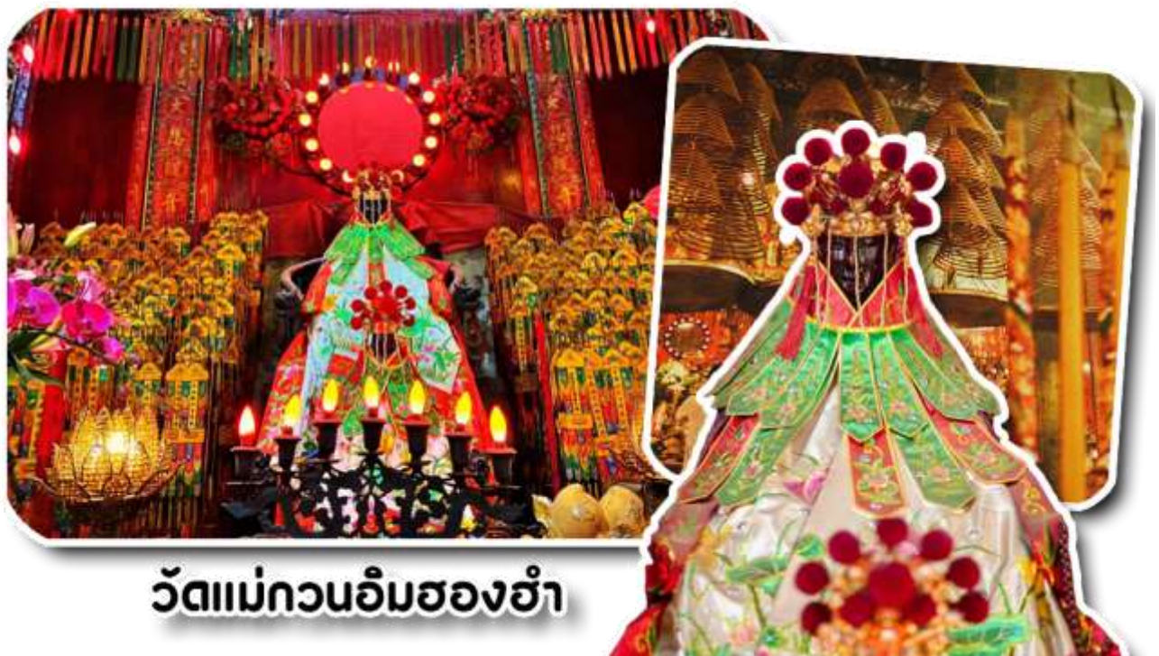
วัดแม่กวนอิมฮองฮำ

พาท่านเดินทางไปไหว้ขอพรขอเงิน วัดแม่กวนอิมฮองฮำ วัดเก่าแก่ของฮ่องกงสร้างตั้งแต่ปี ค.ศ. 1873 เป็นวัดขนาดเล็กที่มีชาวฮ่องกงศรัทธานับถือกันเป็นอย่างมาก วัดแห่งนี้เป็นที่ประดิษฐาน องค์เจ้าแม่กวนอิมฮองฮำ ที่มีชื่อเสียงเรื่องการให้กู้ยืมเงิน เชื่อกันว่าท่านช่วยพลิกฟื้นเศรษฐกิจของชาวฮ่องกง ผู้คนจึงนิยมมายืมเงินทำธุรกิจจนสำเร็จร่ำรวย รุ่งเรือง โดยให้ท่านอธิษฐานขอพรต่อหน้าเจ้าแม่กวนอิมฮองฮำ พร้อมกับระบุวันเวลาในการขอพรด้วย จากนั้นนำธูปธบายตามฐานะและศรัทธาที่เราจะนำเป็นสื่อในการขอพร เขียนจำนวนเงินที่ต้องการลงไปด้วย ใส่สกุลเงินยิ่งดีใหญ่ แล้วนำเงินใส่ในซองแดง ควรเตรียมซองแดงไปเอง นำซองแดงไปวางรอบกระถางรูป วนขวาจำนวน 3 ครั้ง แล้วเก็บซองแดงในกระเป๋าสตางค์ เป็นเงินขวัญถุง ถ้าประสบความสำเร็จตามที่มุ่งหวัง ให้นำเงินในซองแดงทำบุญหยอดตู้ที่วัดแห่งนี้ในโอกาสต่อไป วิธีไหว้ให้ปัง ให้ได้โชคลาภเงินทอง ต้องไปกับเราเท่านั้น