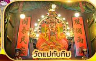
วัดแม่ทับทิม