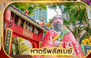
หาดรพลัสเบย์