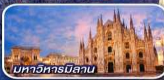
มหาวิหารมิลาน