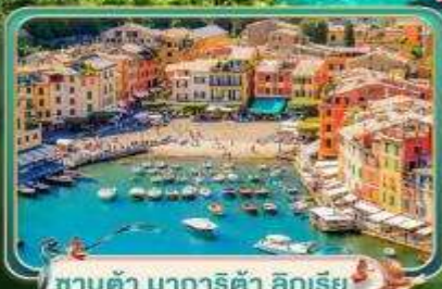
ซานต้า มาการิต้า ลิกูเรีย