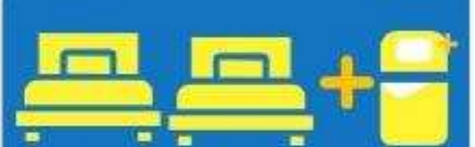
เตียง 3 ท่าน ที่นอนเสริม TRIPLE