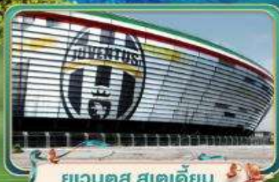
ยูเวนตุส สเตเดียม

เที่ยวฟรีโตฟีไฟ หมู่บ้านตากอากาศสุดไฮโซ ณ ชายฝั่งริเวียร่า