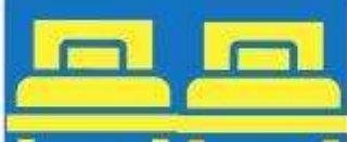
ห้องพักเตียงคู่ TWIN