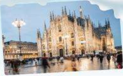
คูโอโม มิลาน