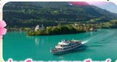
ล่องเรือทะเลสาบเบรียนซ์

พิชิตยอดเขาชุนเนกกา 1 ในเขาที่สวยงามที่สุดเมืองเซอร์แมท