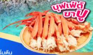
บุฟเฟ่ต์ ชาบู