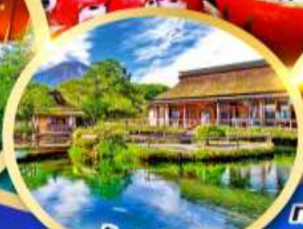
หมู่บ้านน้ำใสโอชิโนะอัทโท