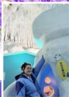
พิพิธภัณฑ์น้ำแข็ง