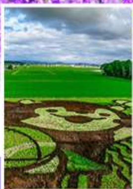
ศิลปะบนทุ่งข้าว