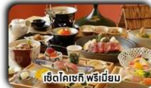
เซตโคเชกิ พรีเมียม