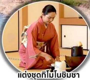
แต่งชุดกิโมโนชิมชา