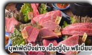
บุฟเฟ่ต์บั้งย่าง เนื้อญี่ปุ่น พรีเมียม