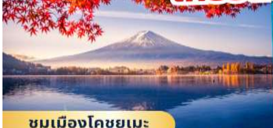
ชมเมืองโคชูยูเมะ