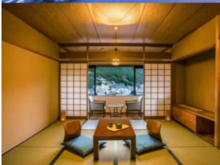
Standard Japanese-style Room 49.5m