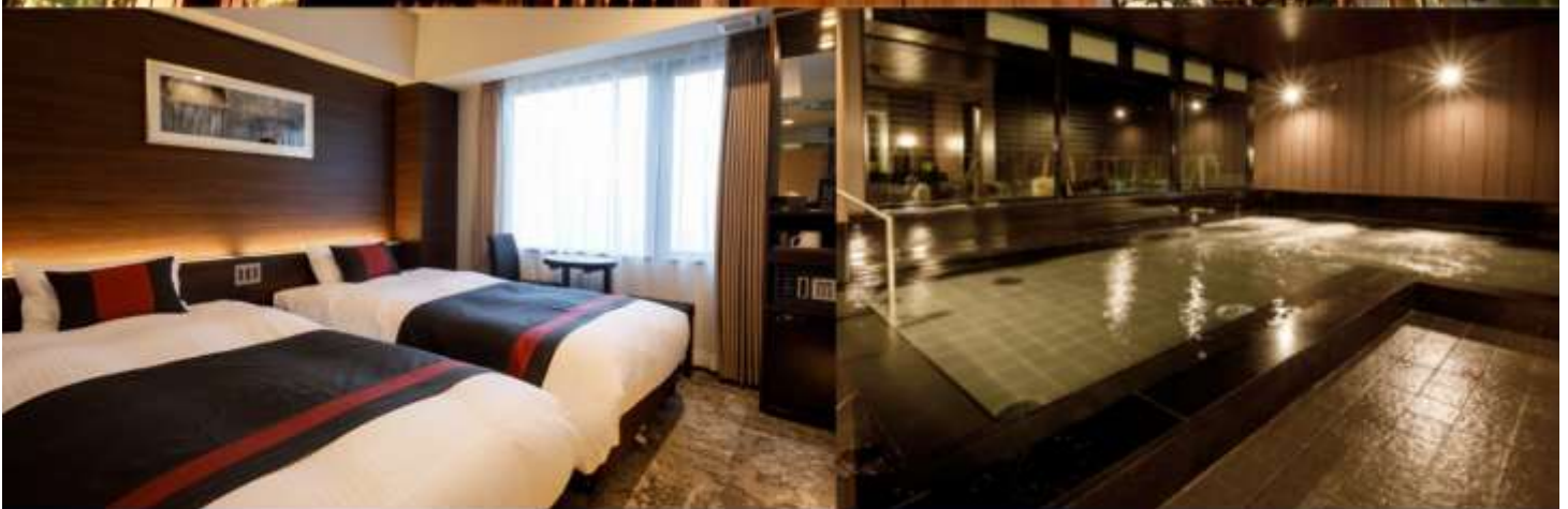
Standard Twin Room 16-17 sqm