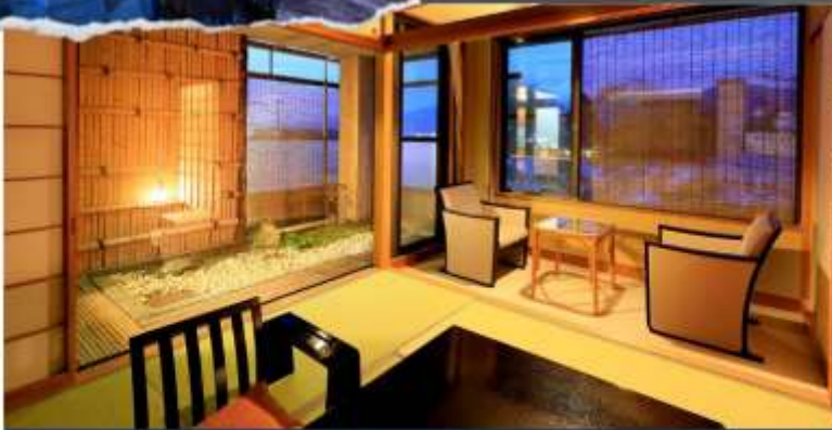
Japanese-style Room 17 sqm