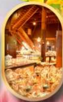
พิพิธภัณฑ์ถ้ำออนเซ็น