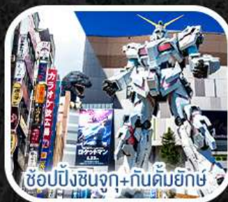
ช้อปปิ้งชินจูกุ+กันดั้มยักษ์