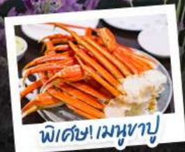
พิซซ่าเมฆาญี่ปุ่น