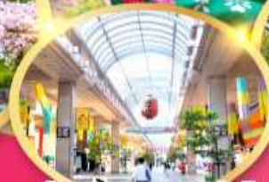
ช้อปปิ้ง ถนนอิชิบังโจ