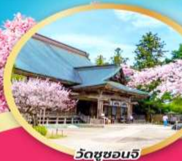
วัดชูซอนจิ