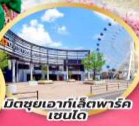
มิตซูเอาก์เลิตพาร์ค เซนได

จุดชมซากุระเริ่มต้น ฮิโตะเมะ เซ็มบง ซากุระ เริ่มต้น