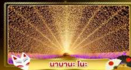
นานาะ โนะ