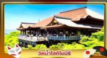
วัดน้ำสอโยมิชิ