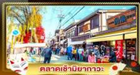
ตลาดซามิยากาวะ