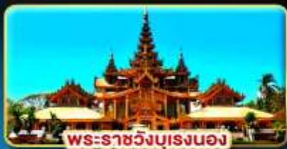
พระราชวังบุเรงนอง