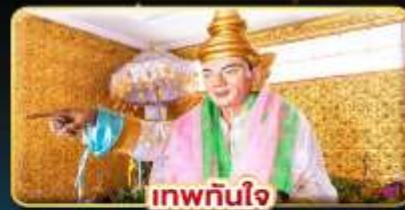
เทพกษัใจ