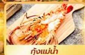
กุ้งแม่น้ำ