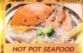
HOT POT SEAFOOD