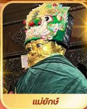
แม่ยักษ์