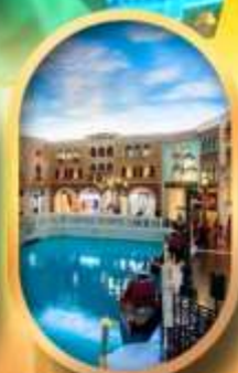
เดอะเวนิเซียน