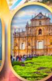
โบสถ์เซนต์พอล