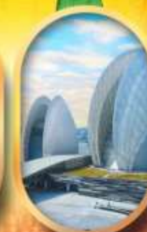
โรงละครไข่มุก