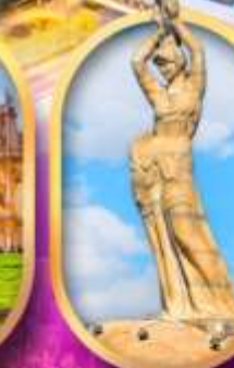
เด็กหญิงชาวประมง