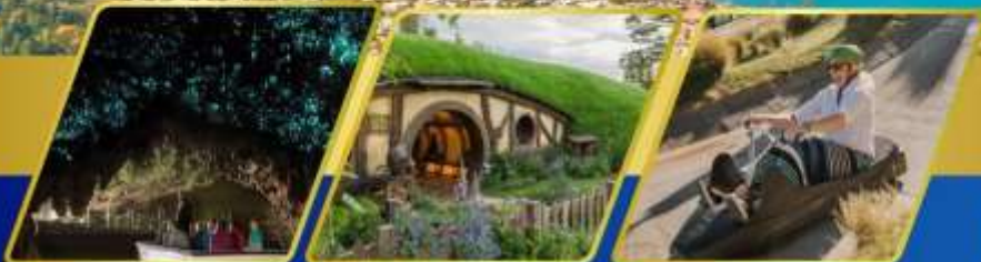
ถ้ำหอนเรื่องแสง หมู่บ้านฮ็อบบิต เล่นลู่ที่ควีนส์ทาวน์

บินภายใน ( เกี่ยวสุดคุ้ม ) พักโรงแรม 4 ดาว ★★★★★