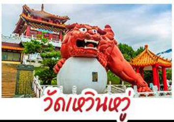
วัดเหวินหู

อาลีซาน - ทะเลสาบสุริยจันทร - ไทเป101 วัดเหวินหู - อนุสรณ์สถานเจียง ไคเชก วัดหลงซาน - ตลาดกลางคืนซีเหมินติง เมนู หม้อหนึ่งจิรพรรดิ - เขียวหลงเป่า - ชาบูไต้หวัน