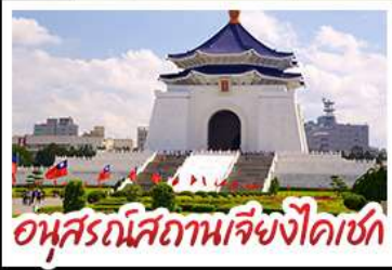
อนุสรณ์สถานเจียงไคเชก