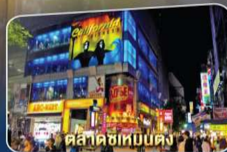
ตลาดซิเหมินตง